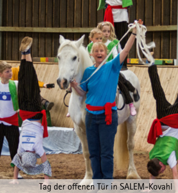
Tag der offenen Tür in SALEM-Kovahl