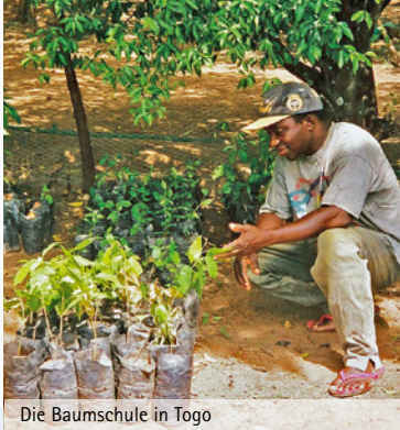
Die Baumschule in Togo