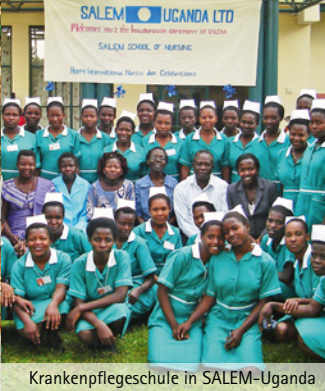
Krankenpflegeschule in SALEM-Uganda