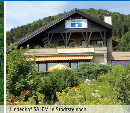
Lindenhof SALEM in Stadtsteinach