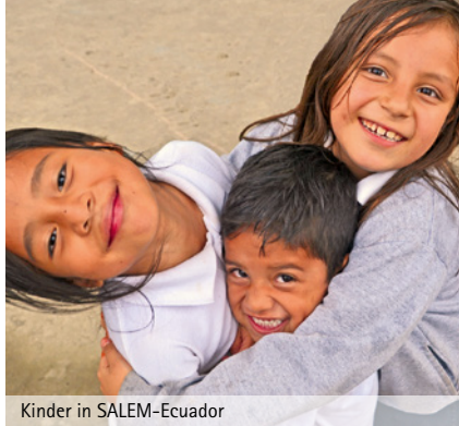
Kinder in SALEM-Ecuador