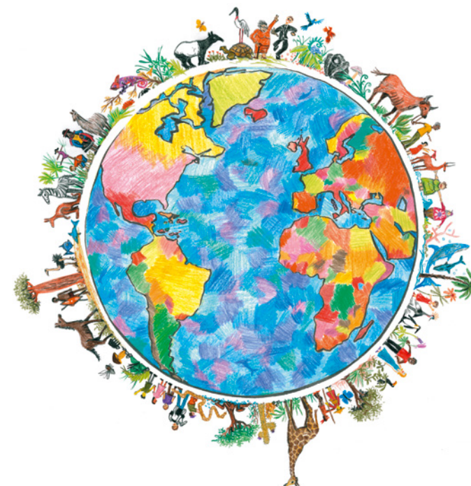
Illustrationen: Stefan Hage