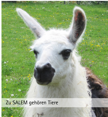
Zu SALEM gehören Tiere