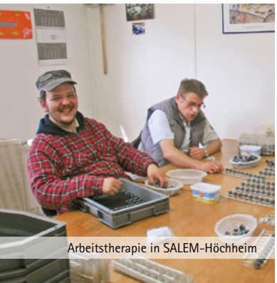
Arbeitstherapie in SALEM-Höchheim